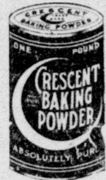
CRESCENT NOSTAKE JAUHOA

Ymmärrätkö todellakin kuinka suuresti tulos riippuu nostokajouhoista. Näinä aikoina kun kaikenlaiset jauhot ovat käytettävissä, neuvoimme teitä käyttämään