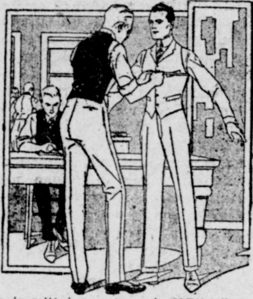
Meillä ei ole valmiita vaatteita myytävänä. Liikkeemme asiamiehet, joita löytyy lähes kaikissa valtioissa Yhdysvalloissa, ovat läheneet juuri Teitä varten liikkeelle. TÄYDELLINEN TYYTYVÄISYYS VAKUUTETAAN ELI RAHAT PALAUTETAAN.

HALUTUANA vielä lisää uusia toimelaita ja rehellisiä asiamiehiä niihin valtioihin eli niille paikkakunnille, joissa niitä ei vielä ole. O. A. HAYSAR BROS. & CO. 358-366 W. MADISON ST. CHICAGO, ILL.