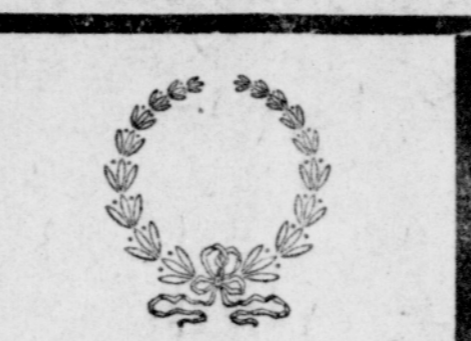
Surulla ja kaipauksella ilmotan, että kuolema on vaatinut uhriseksi rakkaimaan elämän toverini,

Hautaus pidetään torstaina kello 1 iltapäivällä Pohlin hautausmaastosta