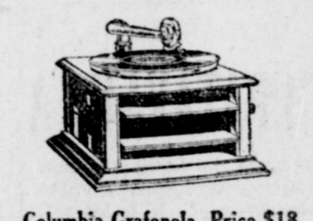
Columbia Grafonola, Price $18