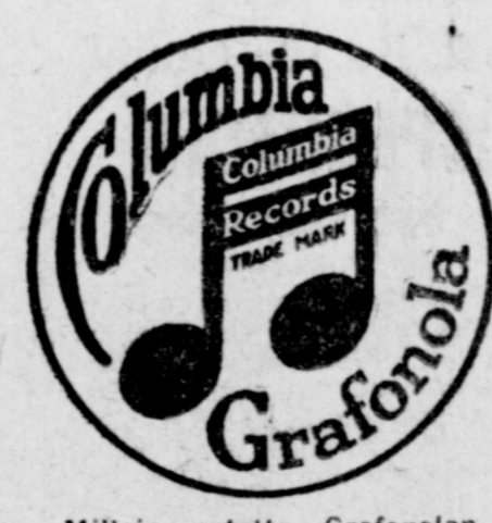
Milloin ostatte Grafonolan tahi levyjä, katsokaa tätä tehtaan leimaa. Se takaa hyvyyden.