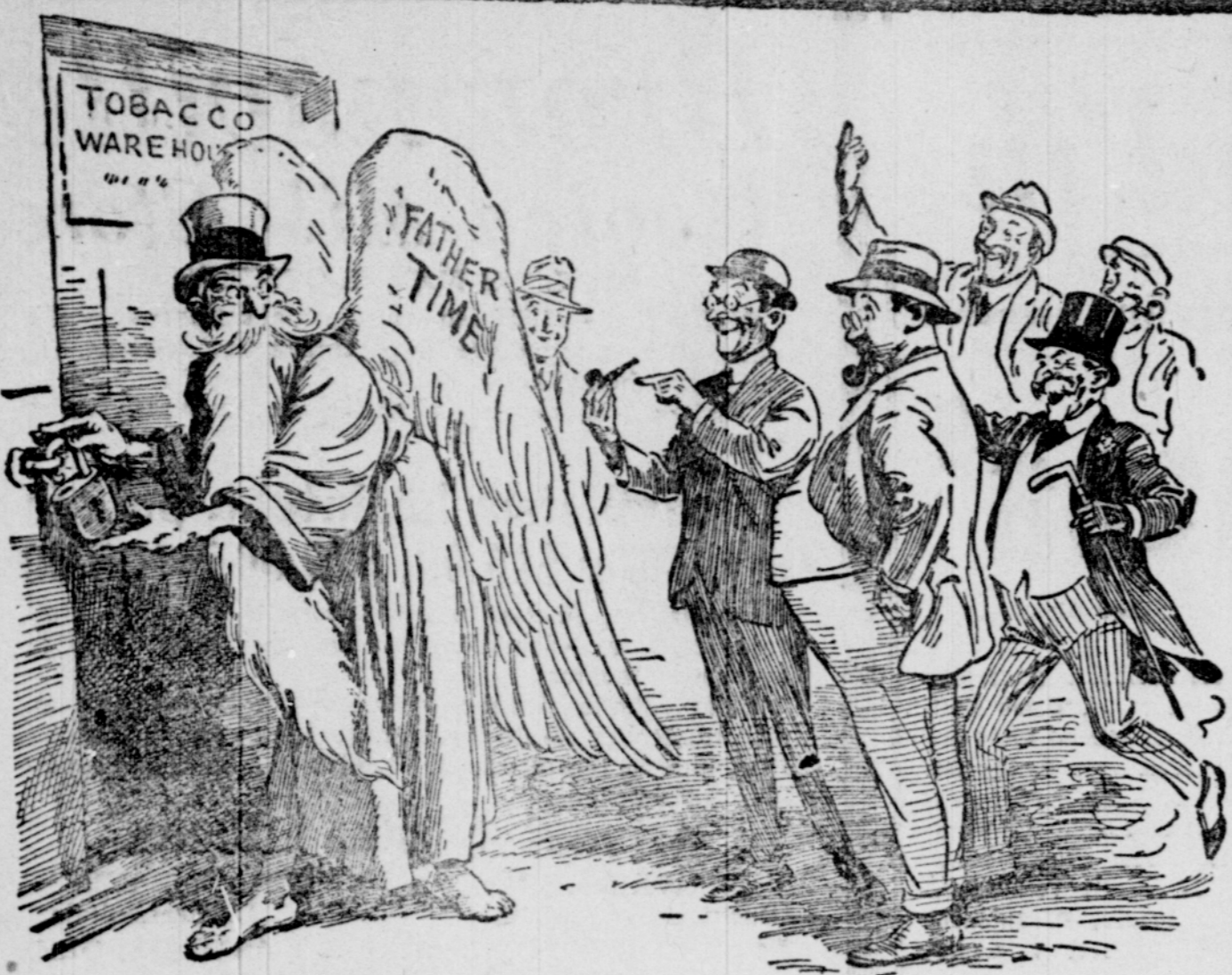
“Minä en voi antaa teille tätä kahteen vuoteen. Tämä on VELVET”iä varten.”