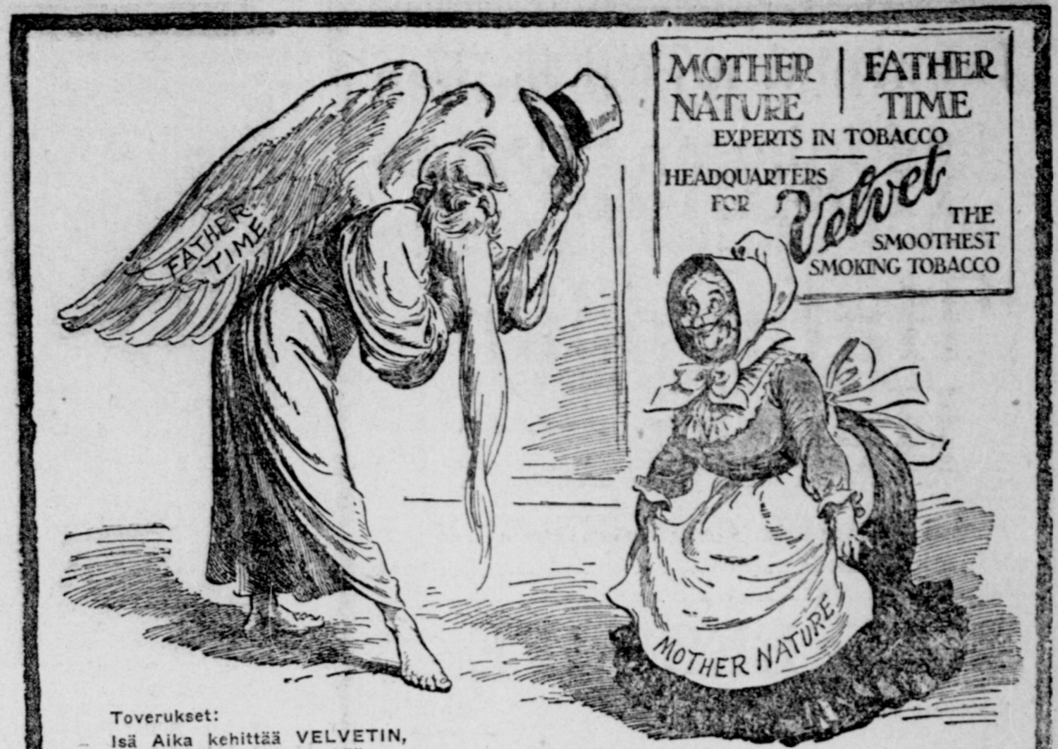
Toverukset: Isä Aika kehittää VELVETIN, Äiti Luonto sen kypsyyttä.

Kannattakaa niitä liikkeitä, jot- ka ilmoittavat Toverissa.