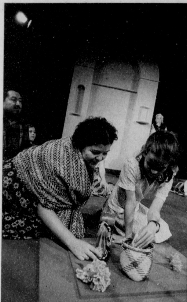
Children can learn about traditional Mexican practices during Days of the Dead through the Miracle Theatre. They will be having a festival to honor the occasion until Nov. 11 at El Centro Milagro, located at 525 SE. Stark.

Mexico's festival of the Days of the Dead is an observance with very ancient roots. For pre-Hispanic cultures, life was considered to be no more than a passing moment, a dream from which one would wake up again amongst the dead. On these days, it is believed the dead come from beyond to visit with the living. Special foods are prepared, breads are baked, and altars to the dead and cemeteries are cleaned and decorated with flowers. The souls of the dead are said to return from the after-life to visit the living, where they consume the food and drink left for them. The living receive the dead with merriment and music!