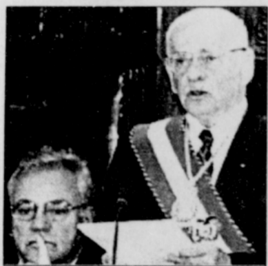
Bolivian President Hugo Banzer will resign on Aug. 6 due to health problems. Banzer is currently being treated for cancer in the United States.

cal el viernes pasado. Una semana antes de someterse a una segunda sesión