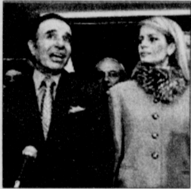
Former President Carlos Menem of Argentina with his wife.