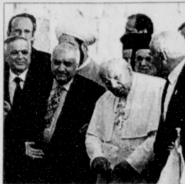
Pope John Paul II visits the Golan Heights in Syria.

QUNEITRA, Syria (AP) Pope John Paul II took his message of reconciliation to the Golan Heights, praying for peace and forgiveness in a town where buildings smashed by war with Israel stand as a reminder of continuing conflicts in the Mideast. Applause broke out as John Paul entered a Greek Orthodox church that, like the rest of Quneitra, is in ruins. Several children approached the pope to be kissed and blessed, and aides helped the frail 80-year-old kneel to pray.