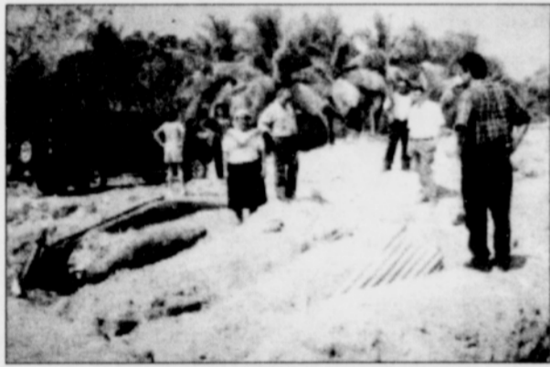
A Honduran lady shows others her home stuck under mud from the devastation of Hurricane Mitch.