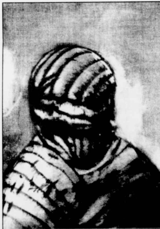
La Momia (The Mummy)

mons and ghouls. The predominant color scheme is one of rich earth tones: oxidized bronze and copper, dirt-red and moss green. Yet these hues are somehow tempered with a dark tinge of pain and frustration.