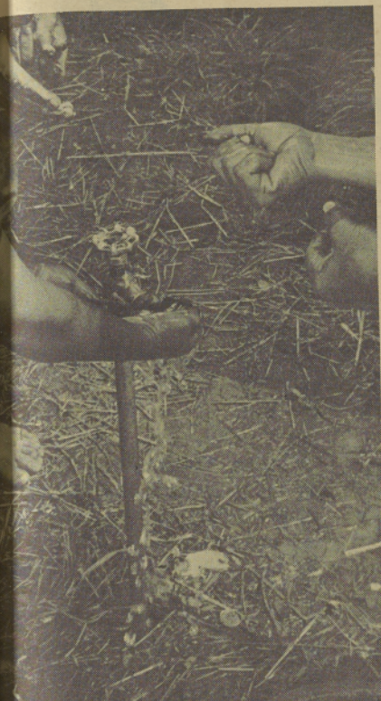
Water to wash away the stains of work. Agua para lavar las manchas del polvo.

En Oregon somos bendecidos con suficiente agua fresca, limpia y sabrosa. Un encampamento de trabajadores migratorios tiene llaves al aire libre para proveer agua. Los requisitos de la ley se cumplen. Después de un día de trabajo arduo en los campos se necesita suficiente agua y jabón para lavarse bien.