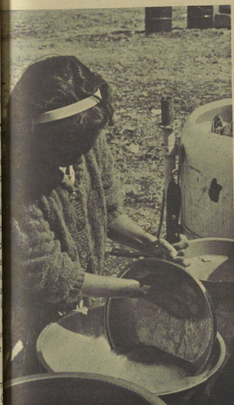
Water to wash clothes and dishes. Agua para lavar la ropa.

El agua tibia es muy apreciada en un encampamento de trabajadores migratorios. Es bueno bañarse en agua caliente después de un día de trabajo. El agua se calienta en la estufa para lavar los platos. La mayor parte de los encampamentos proveen facilidades para lavar ropa.