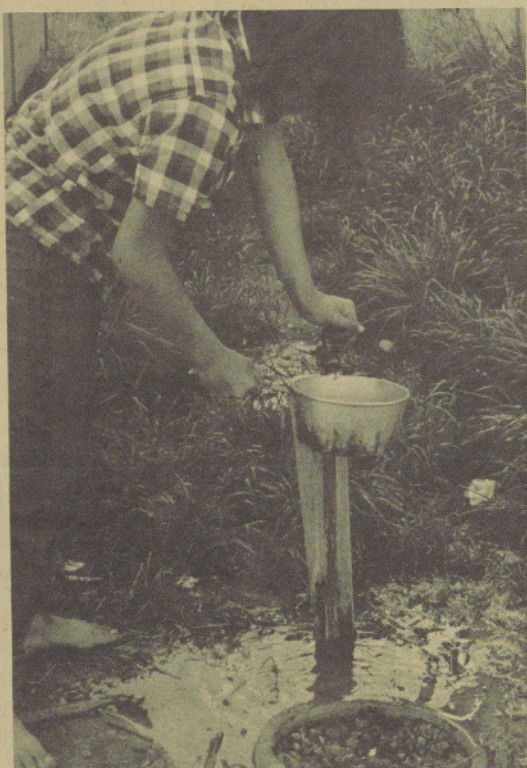
Fill the pan with water and cook your food. Llene la olla de agua para cocinar la comida.

Los niños ayudan llevar el agua a la casa para cocinar y limpiar. Las llaves están cerquitas; entre las casas. A todos nos faltaría mucho el agua si no fuera suficiente. Nos podemos considerar afortunados al tener lo suficiente para cocinar, limpiar y lavar.