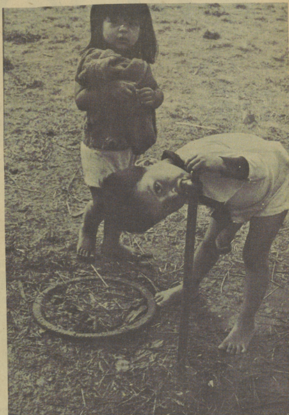
A drink of water. Una bebida de agua.

Muchos turistas que vienen a Oregon nos han felicitado por nuestra agua sabrosa. El agua limpia, dulce y sabrosa; la mejor cosa para un día caluroso de verano.