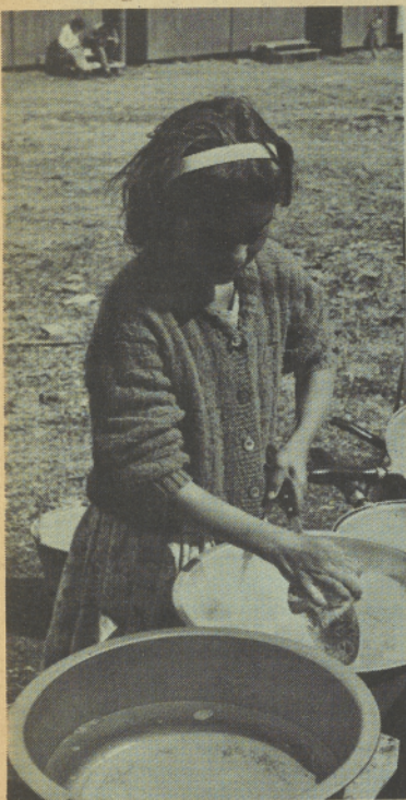
KEEPING HOUSE WHEN MOTHER IS IN THE FIELDS