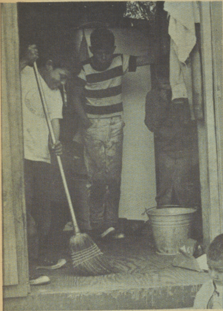
SWEEPING OUT THE DUST