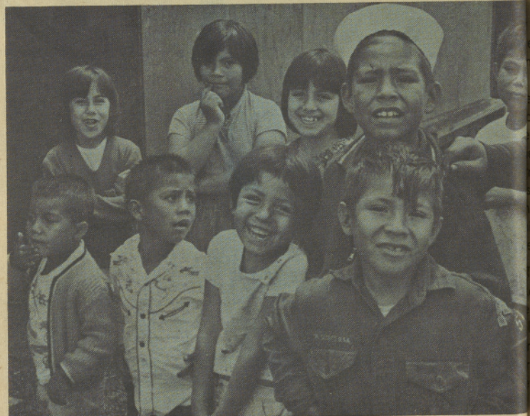
SOME OF THE BEST CHILDREN ARE RIGHT HERE