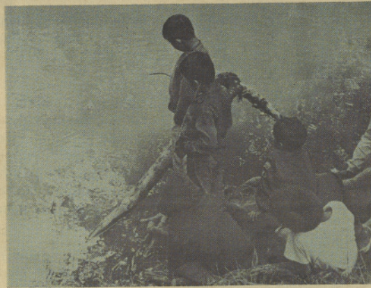
DREAMING SUMMER DREAMS