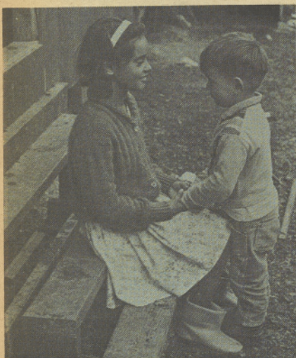
CARING FOR A BROTHER ALL DAY LONG

No es fácil para muchas familias vivir en los campamentos migratorios. Pero allí se encuentran niños alegres, creativos y bondadosos. Darles la oportunidad, ellos contribuirán a nuestra sociedad.