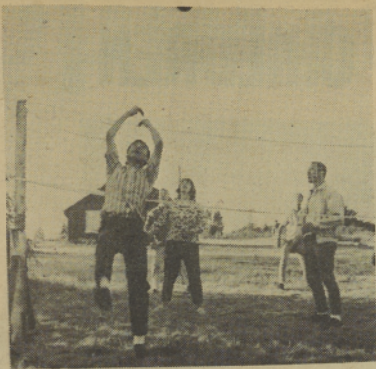
They organize volleyball . . . Organizan juegos de volleyball . . .