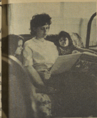
They read to children . . . Leen a los niños . . .

Ahora, hace dos semanas desde que empezó la clase. Se reúne cada lunes y miércoles de las 7:30 a 9:30 de la noche. Hay unos 20 estudiantes. Esperamos que 20 certificados de G.E.D. pronto sean distribuidos en el área de Sandy.