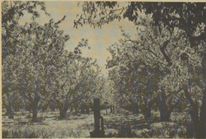
THESE PEAR trees will give "yellow gold" to the Medford ranchers this fall. Will there be enough pickers to "mine" the trees?

ESTOS ARBOLES de pera darán "oro amarillo" a los agricultores de Medford este año. ¿Habrá bastantes piscadores para "minar" los arboles?