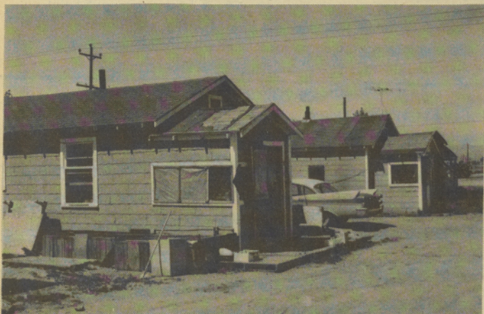
THESE PRIVATELY-OWNED houses rent for $10.00 a week. Workers find that there are few houses to rent during the pear harvest.

ESTOS ARBOLES de pera darán "oro amarillo" a los agricultores de Medford este año. ¿Habrá bastantes piscadores para "minar" los arboles?