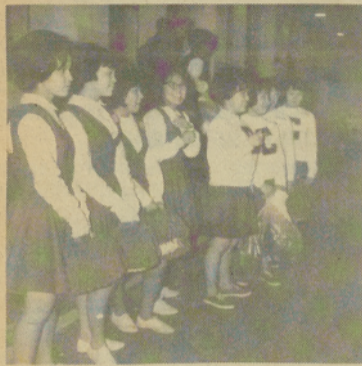
THE CHEMAWA Indian School rally squad had a lot to yell about last week. They beat West Stayton 57-41.

EL RALLY SQUAD de la Chemawa Indian School tuvo mucho razon para gritar. Ganaron contra West Stayton 57-41.