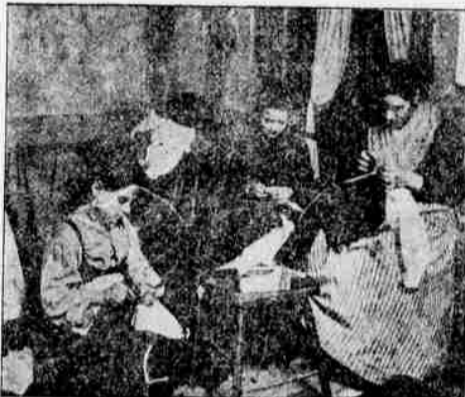
EI LEPOA KENELLEKÄÄN

Ja kun perheessä sattuu sairautta, jota usein työläisperheessä sattuu juuri siitä syystä, että ei ole ollut tarpeellista ravintoa ja hoitoa, eikä äiti ole tietänyt ja